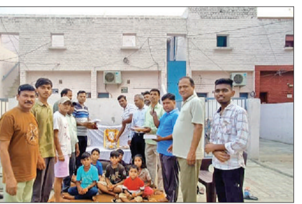
महान संत कबीर दास जी की जयंती पर कार्यक्रम का किया गया आयोजन