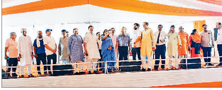
जीत का मंत्र देते : केंद्रीय स्तर के नेता रविवार को एक साथ एक ही मंच पर कार्यकर्ताओं के साथ मिलकर जीत का मंत्र देते।