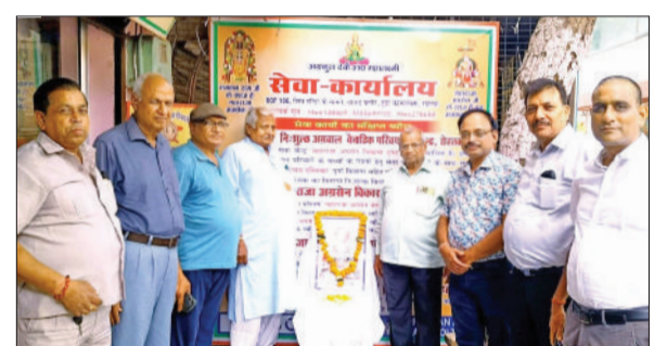
रोहतक। संत कबीर के चित्र पर फूल माला अर्पण कर उनको नमन करते हुए महाराजा अग्रसेन विकास ट्रस्ट के पदाधिकारी।